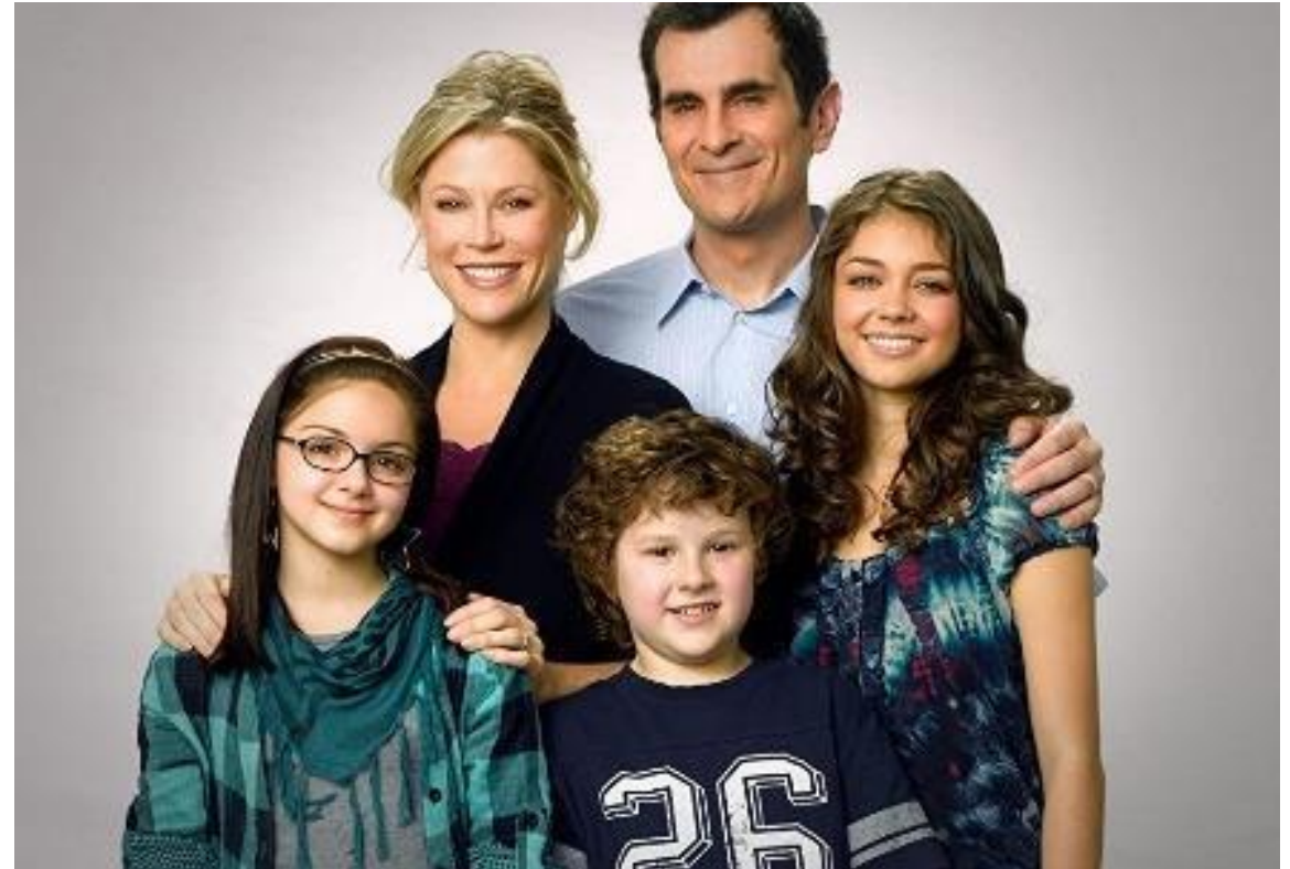
Modern Family . Lloyd-Levistan Pictures. 2010.

Cette photo évoque la masculinité et la féminité classique et familiale.