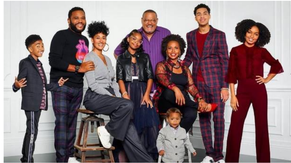
Black*ish . Kenya Barris. 2022.

Cette photo présente la masculinité et la féminité « traditionnelle », et familiale noire.